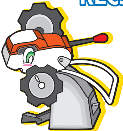
クリーンアップサンド号