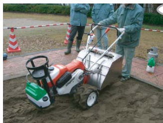
砂の「かき混ぜ、ふるい、消毒、加熱処理」の1台4役！