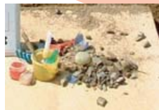
たくさんのごみが出てきました！