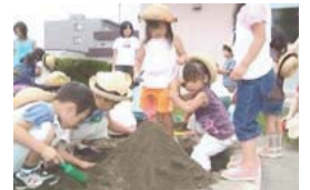
フカフカの砂場は楽しいな

その場で機械1台で攪拌、ゴミ除去、消毒すべての作業を行なう。 ↓ 作業が効率的。 表面から内部まで消毒。